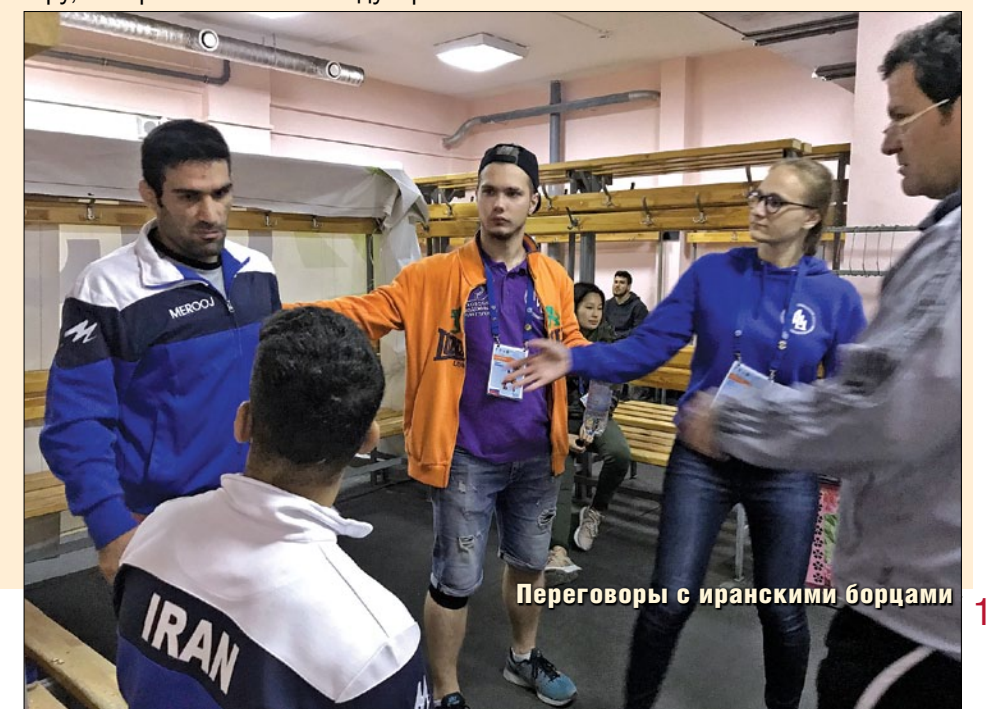
Переговоры с иранскими борцами