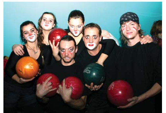
Команда ГСИИ первая в общем зачете

Интересно отметить, что если команда была в единой форме, это приносило в ее копилку 30 дополнительных очков. Кто как изощрялся: артисты разукрасили свои физиономии гри-