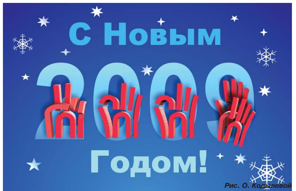
Рис. О. Кодылевой