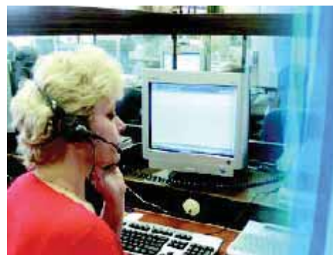
Диспетчерская телефонная служба для глухих начинает предоставлять новую ус-

лугу для неслышащих москвичей: прием SMS-сообщений. В настоящее время обслуживаются номера мобильных телефонов МТС.