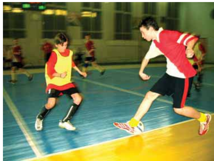
Эпизод финальной игры

В подгруппу «А» вошли команды из 101-й, 22-й и 65-й школ, а в подгруппу «Б» из 30-й, 37-й и 52-й, занявшие соответ-