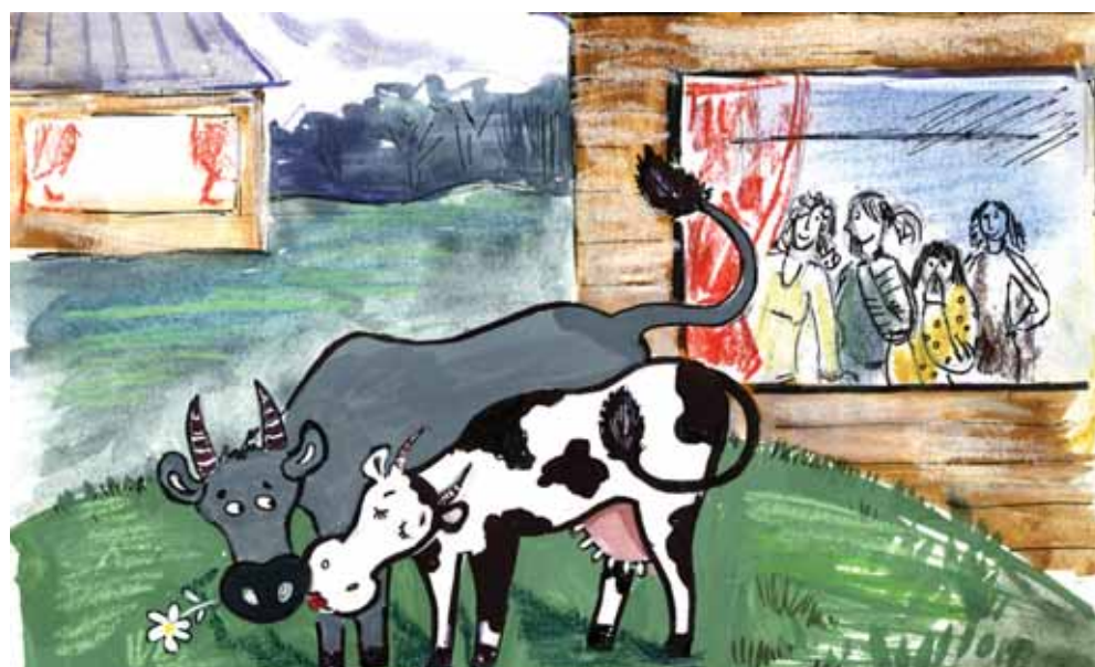
Рисунок Ю. Теслер

За окном огромный красавец бык обхаживал молодую телку, которую привели к нему на случку. Делал он это виртуозно. Подходил то спереди, то сзади, нежно