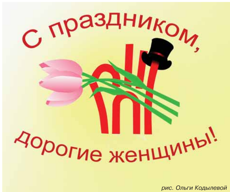
рис. Ольги Кодылевой