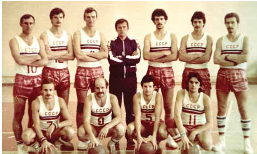
Сборная СССР. Золото Европы.