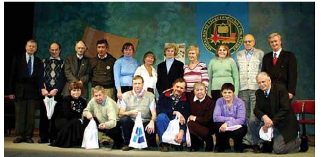
Самые активные члены Клуба глухих туристов

В конкурсе капитанов вопрос туристов: «Как появился праздник «Нептун»?» — застал нептуновцев врасплох. Они ответили, что это такой летний праздник, где все купаются на