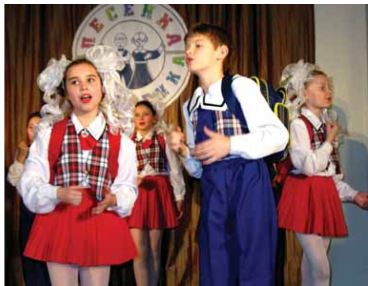
Ансамбль «Чудеса» (школа № 52): «Мы такие разные...»