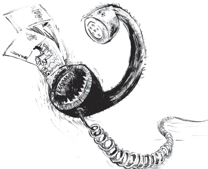
Рисунок Екатерины Балеевской

— Многие глухие абоненты МГТС пользуются факсами. Пересылка факса занимает гораздо больше времени, чем разговор. Часто вызываемый номер не всегда сразу переключается на факс. Отражается ли это на оплате? Ведь плата берется за соединение, хотя прохождения факса мощи и не быть!