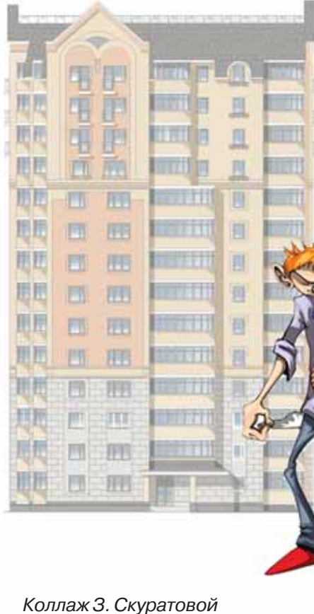
Коллаж З. Скуратовой

По этому варианту Ивановы покупают квартиру у города на льготных условиях. Жилищный департамент заключает с Ивановыми договор купли-продажи с рассрочкой платежа сроком на 10 лет под определенный процент (сейчас это 10%). При заключении договора Ивановы должны внести от 20 до 40% от стоимости