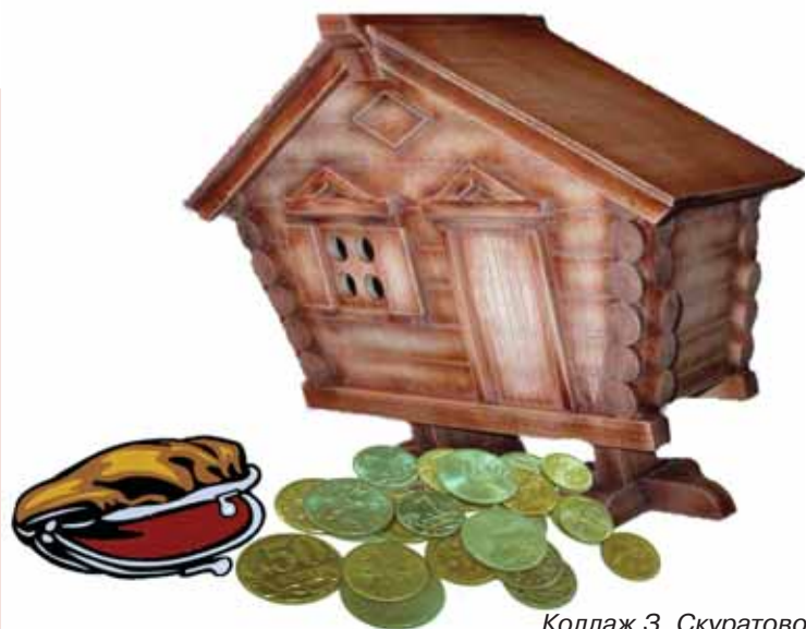
Коллаж З. Скуратовой

“Избушка, избушка! Может быть, на тебя денюжек хватит?”