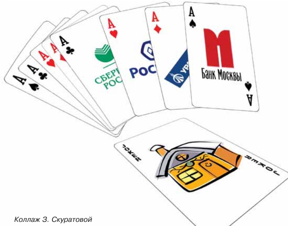
Коллаж З. Скуратовой

мая информация о предоставляемых им услугах, в том числе и об ипотечном кредите. Частенько встречается и такая фишка, как ипотечный калькулятор. С его помощью можно рассчитать максимальную сумму кредита, которую может выдать банк в зависимости от уровня доходов. Или посчитать месячные выплаты в зависимости от суммы кредита. Вот я и погуляла по сайтам вышеперечисленных банков и пощелкала по этим калькуляторам.