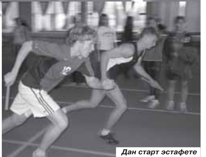
Дан старт эстафете