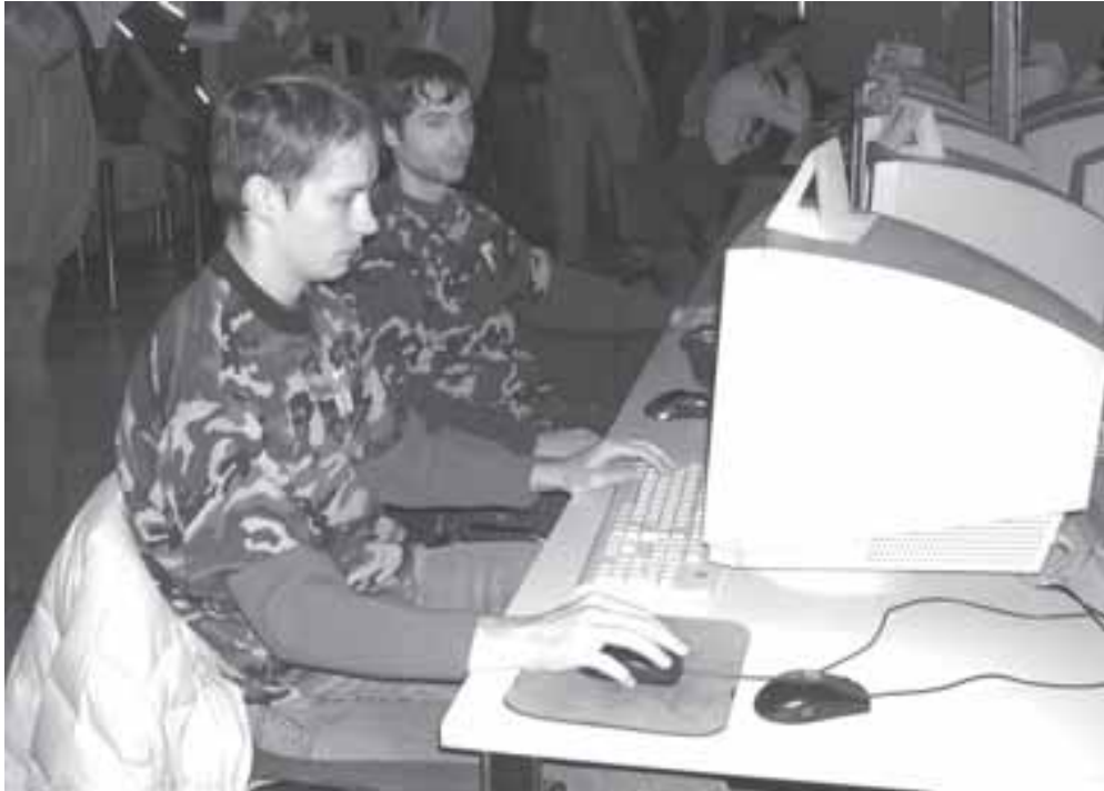
Чемпионат начался. Теперь все внимание на монитор...