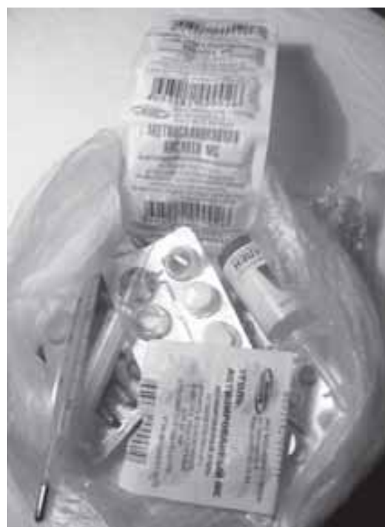
Фотоколлаж З. Скуратовой

возрасте, ведь зачастую лечение серьезного заболевания потребует затрат значительно больших, чем 450-500 руб. в месяц», - убеждали статьи.