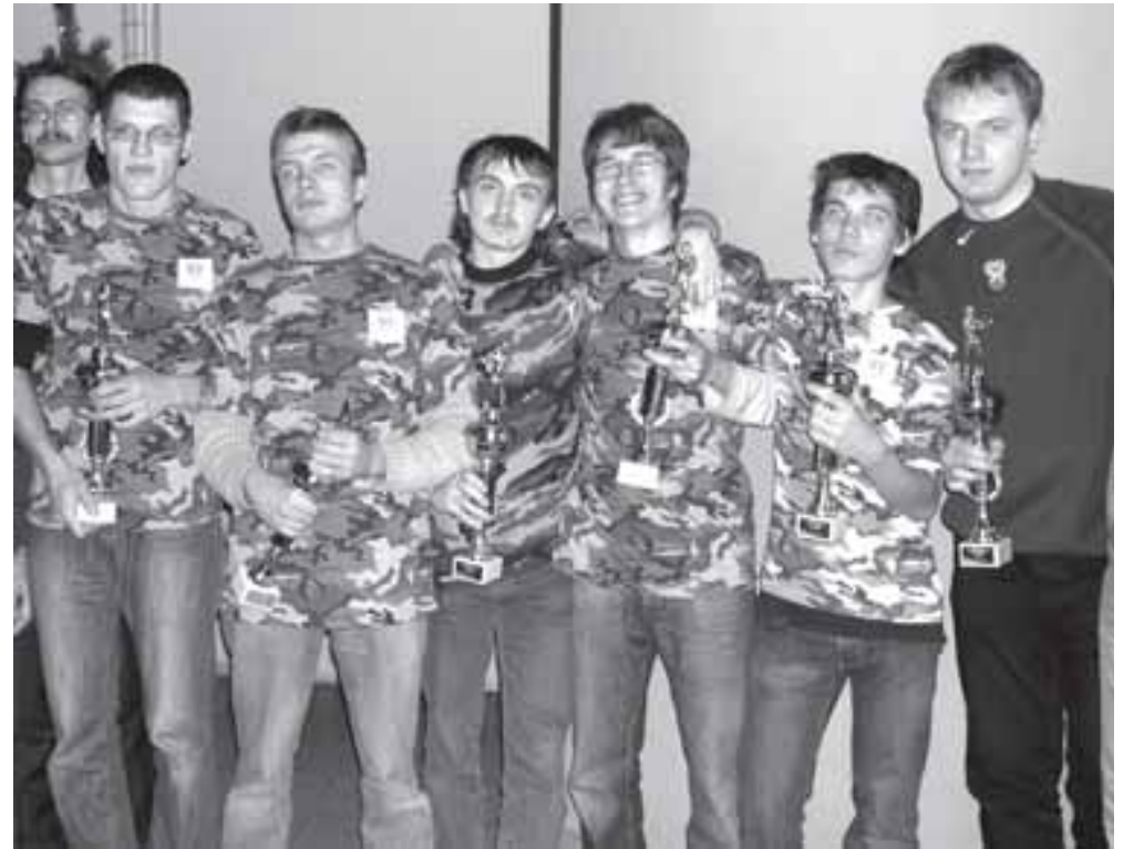
Победители Первого Чемпионата г. Москвы среди глухих по играм «Warcraft» и «Counter-Strike»

PS. 24 декабря наконец-то состоялись заключительные (финальные) соревнования Чемпионата г. Москвы среди глухих по киберспорту! Они прошли в интернет-клубе "Иные миры", недалеко от метро «Улица Подбельского».