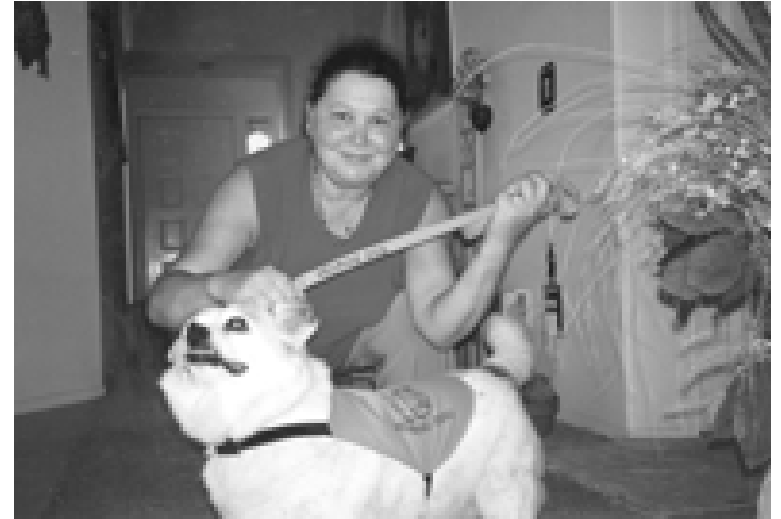
Фото 1. Слепая участница Конгресса полностью «экипирована». Правая рука в руке переводчицы. Левая рука держит поводок с собакой. Умная собака на пути своей хозяйки загрохивает собой все выступы и помехи на дороге.

От редакции: в газете «Московский комсомолец» была информация о том, что отныне инвалиды по зрению ежегодно будут получать компенсацию в размере 10 тысяч рублей на содержание собак – проводников. Соответствующее постановление подписал премьер-министр Михаил Фрадков. Чтобы получить специально обученного песика,