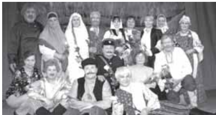
Актеры спектакля в полном составе