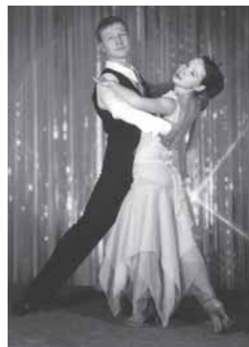
Дуэт «Камертон» из Ульяновска

И этот факт, и весь блестящий состав жюри и Оргкомитета говорят о возрождении традиций меценатства в России.