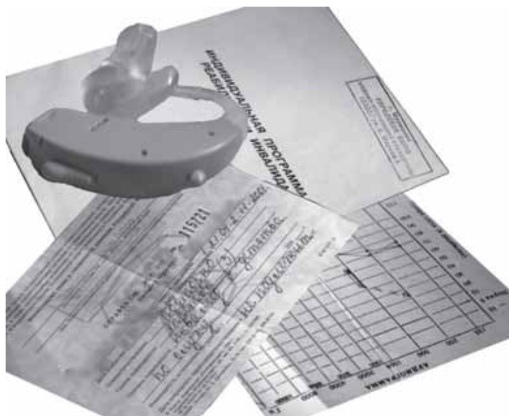
Фотоколлаж З. СКУРАТОВОЙ

ГАЗЕТА МОСКОВСКОЙ ГОРОДСКОЙ ОРГАНИЗАЦИИ ВОГ